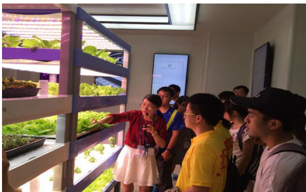
海峡两岸学子研习营 近距离观察厂内植物