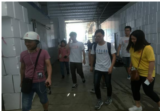
实践队队员走进种植室

7月23日，食品科学学院赴宁德市古田县暑期社会实践队来到晟农食用菌合作社进行参观。晟农食用菌合作社古田县晟农食用菌合作社成立于2009年2月。坐落于“中国食用菌之都”古田县城，经过几年时间的发展壮大，目前厂区内已建成并实现日产20000袋海鲜菇生产规模，日产海鲜菇鲜品10吨。