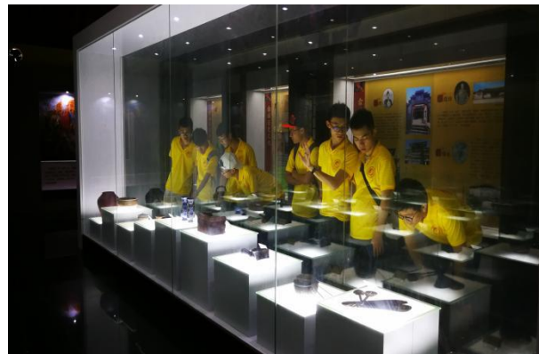
计算机与信息学院“e修哥”电脑义务维修队实践队队员观看畲族文物